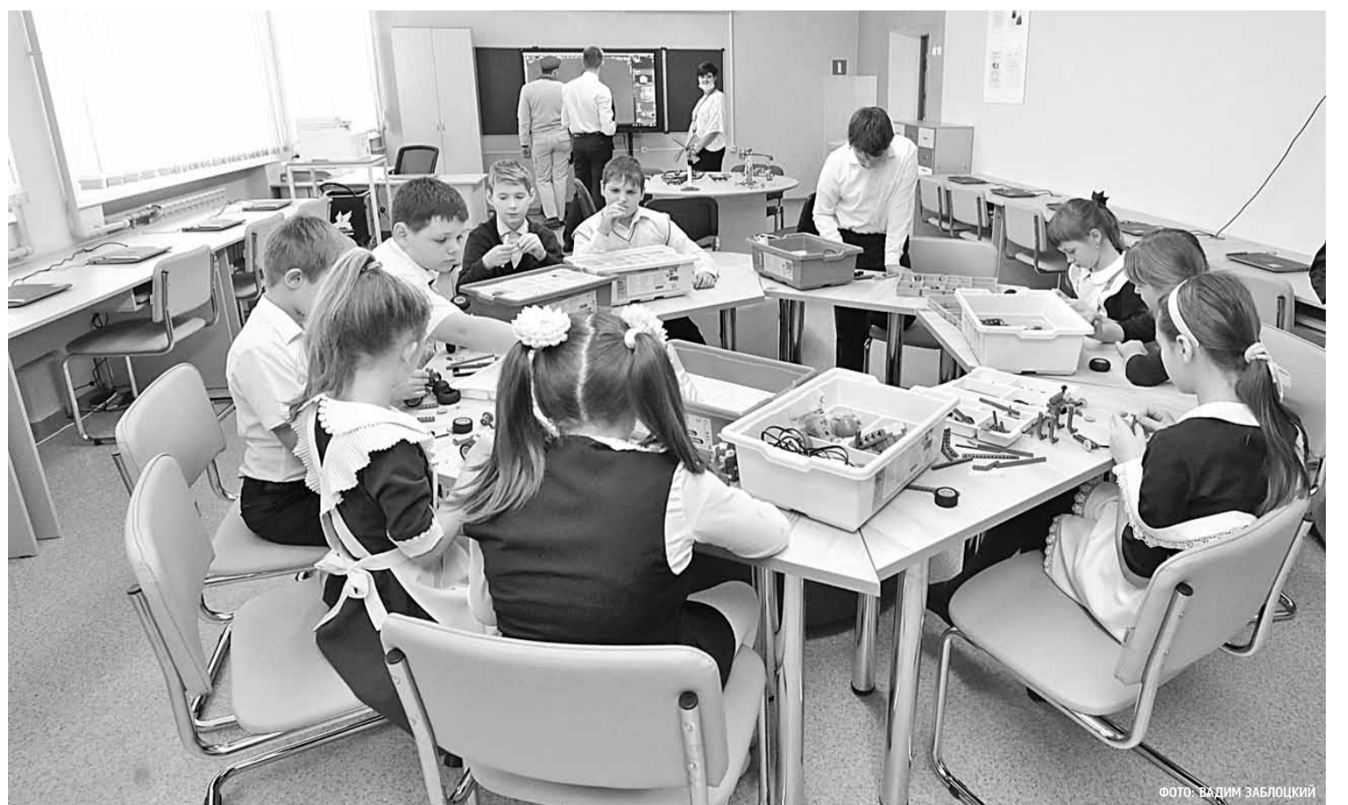
В «Точке роста» Алексеевской школы Корочанского района